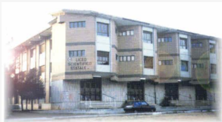
San Nicandro Garganico

LICEO - ISTITUTO TECNICO - ISTITUTO PROFESSIONALE